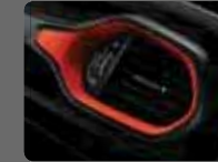
Kırmızı Dikişli Siyah Deri (515) Yakut Kırmızı Çerçeveseler