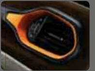
Buz Gri/Kahverengi Deri (513) Turuncu Çerçeveseler