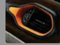
Buz Gri/Kahverengi Kumaş (134) Turuncu Çerçeveseler