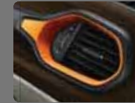
Buz Gri/Kahverengi Deri (513) Turuncu Çerçevesel