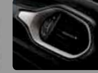
Siyah Kumaş (101) Parlak Gümüş Çerçeveseler