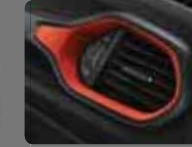
Kırmızı Dikişli Siyah Deri (515) Yakut Kırmızı Çerçevesel