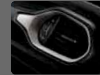
Siyah Deri (506) Parlak Gümüş Çerçeveseler