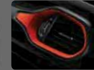
Kırmızı Dikişli Siyah Kumaş (149) Yakut Kırmızı Çerçeveseler