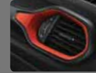
Kırmızı Dikişli Siyah Kumaş (149) Yakut Kırmızı Çerçevesel