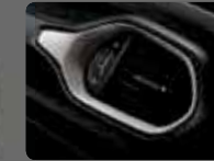
Siyah Kumaş (105) Parlak Gümüş Çerçeveseler